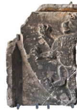
Frammento di lastra tombale con stemma con leone rampante arenaria con tracce di combustione XV secolo