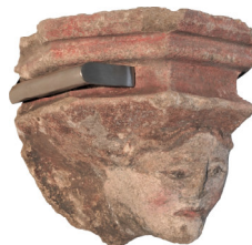
Mensola figurata policroma