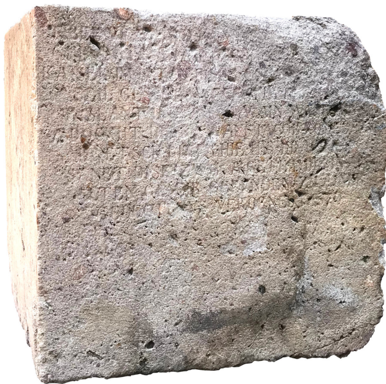
Base per il miliario romano di Rablà conglomerato XVI-XIX secolo