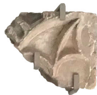
Frammento di lastra con ornamento gotico