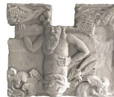
Frammento di lastra tombale intagliata con raffigurazione di "uomo selvatico" arenaria fine XVI secolo