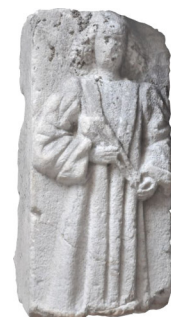
Frammento di piedritto figurato