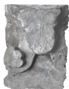
Elemento architettonico figurato

arenaria con tracce di combustione XVI-XVII secolo