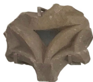
Frammento di cornice di finestra intagliata