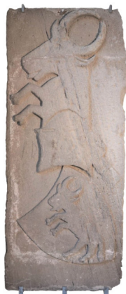
Lastra tombale con stemma Boymont arenaria XIV secolo