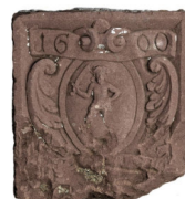
Chiave d'arco con stemma