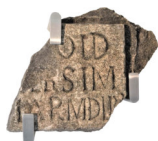
Frammento con iscrizione arenaria datata 1559