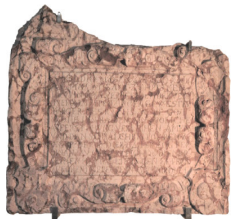
Frammento di lastra tombale di Hieronymus Penzinger calcare ammonitico rosso datata 1573