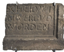
Frammento di lastra tombale con iscrizione

arenaria con tracce di combustione XVI-XVII secolo