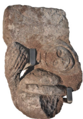
Frammento di capitello figurato