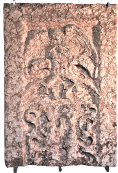
Lastra tombale calcare ammonitico rosso XV-XVI secolo