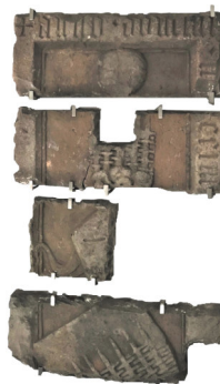
Frammenti di lastra tombale con stemma Kripp arenaria XIV secolo