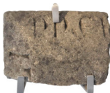
Frammento di lastra tombale con iscrizione gotica arenaria XIV secolo