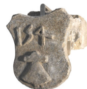
Elemento architettonico con stemma