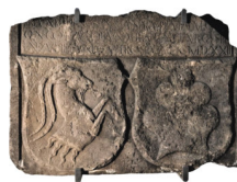
Frammento di lastra tombale con iscrizione e due stemmi affiancati arenaria con tracce di combustione datata 1522