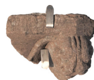
Frammento di capitello