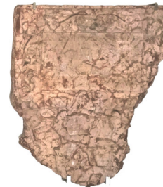
Frammento di lastra tombale di Catharina Lahn - Penzinger calcare ammonitico rosso datata 1560