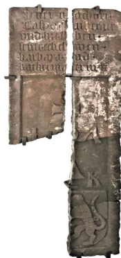
Frammenti di lastra tombale arenaria XIV secolo