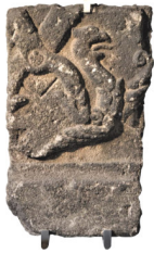
Frammento di lastra tombale con testa di grifone arenaria con tracce di combustione XV-XVI secolo