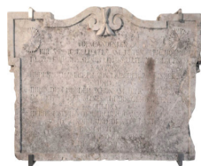
Lastra con iscrizione dedicatoria