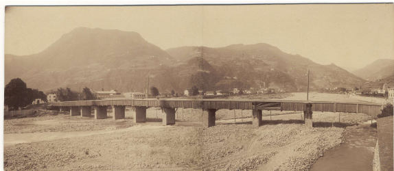
Foto, Die alte Holzbrücke über die Talfer, Atelier Gugler, vor 1899, Stadtmuseum Bozen

Der von Würzer konzipierte Entwurf wurde nicht realisiert. Dennoch könnte er die Anlage jener baumgesäumten Alleen inspiriert haben, die den ersten Park von Bozen bildeten und bereits in der Etschkarte von Nowack 1802-1805 nachweisbar sind.