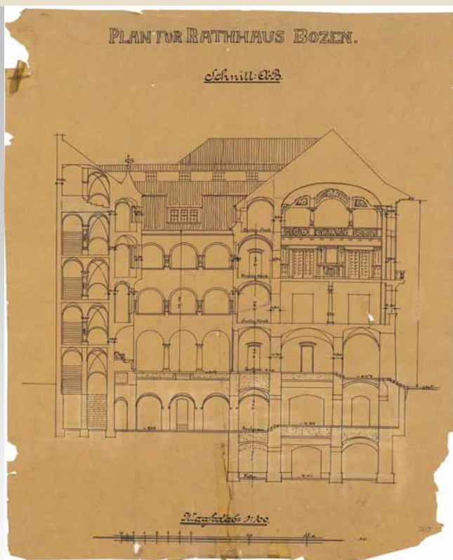
Querschnitt des Rathauses, erster Entwurf, Wilhelm Kürschner (1902?)