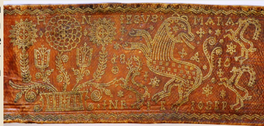
Detail eines Gürtels mit Messingnieten, datiert 1810. Stadtmuseum Bozen