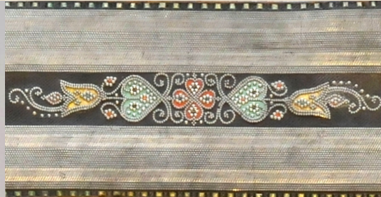
Gürtel mit Zinnstiften und -nieten (oben) und mit Federkielstickereien (links), 1. H. 19. Jahrhundert. Stadtmuseum Bozen