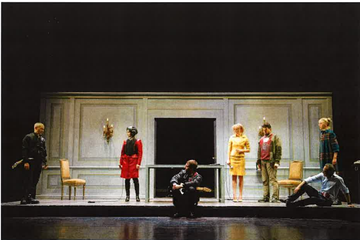
Peachum, Un'opera da tre soldi

Il capitolo di spese per allestimento comprende un budget di spese per il personale artistico e tecnico che lavora alla realizzazione dell'opera, nonché i costi per i materiali scenotecnici di costruzione delle scene, dei costumi e delle attrezzature. Ogni spettacolo prodotto ha un budget di allestimento che viene assegnato alla produzione nei limiti economici e finanziari del capitolo di spesa. All'interno del capitolo pertanto troviamo retribuzioni lorde di specialisti, regista, scenografo, costumista, ecc. e spese di beni e servizi, inoltre sono considerati anche gli oneri sociali e fiscali a carico del teatro.