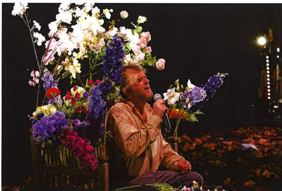
La Gioia

Nel 2021 sono previsti in cartellone al Comunale di Bolzano: Il grigio , di Giorgio Gaber e Sandro Luporini per la regia di Giorgio Gallione, con Elio, La notte dell'innominato con Eros Pagni dello Stabile di Brescia, La mia vita raccontata male In bilico con Claudio Bisio dal romanzo di Francesco Piccolo con regia di Giorgio Gallione (del TS Genova); La gioia di Pippo del Bono di Emilia Romagna Teatro.