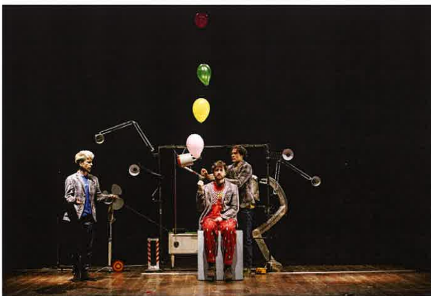
Fa la cosa Faticosa