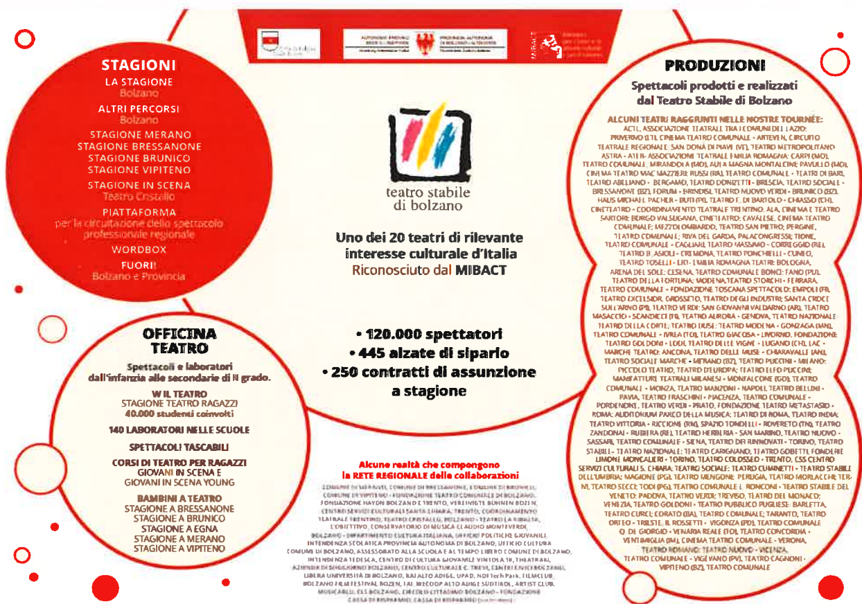
Nello schema si fa riferimento alla situazione preCovid.

Per l'anno 2021 quindi l'attività del Teatro Stabile di Bolzano è più che mai composita, variegata, stratificata e diretta ad un pubblico che sia il più ampio possibile, tenendo sempre presente la natura di territorio di confine in cui il Teatro opera, per cui svolge una funzione fondamentale di riferimento per una comunità ancora giovane, e di ponte linguistico, culturale e identitario per tutti gli abitanti del territorio.