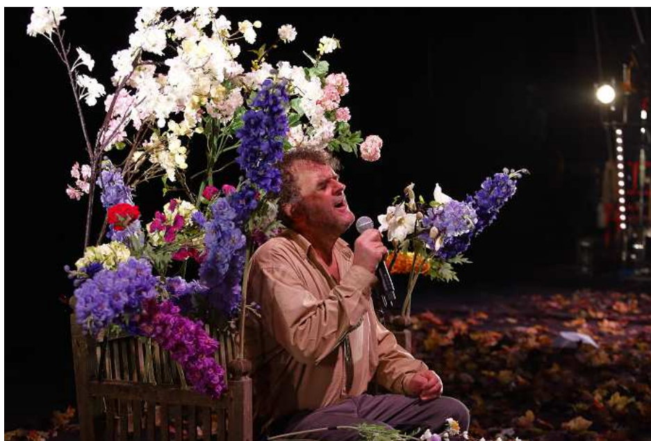
La Gioia

Nel 2021 sono previsti in cartellone al Comunale di Bolzano: Il grigio , di Giorgio Gaber e Sandro Luporini per la regia di Giorgio Gallione, con Elio, La notte dell'innominato con Eros Pagni dello Stabile di Brescia, La mia vita raccontata male In bilico con Claudio Bisio dal romanzo di Francesco Piccolo con regia di Giorgio Gallione (del TS Genova); La gioia di Pippo del Bono di Emilia Romagna Teatro.