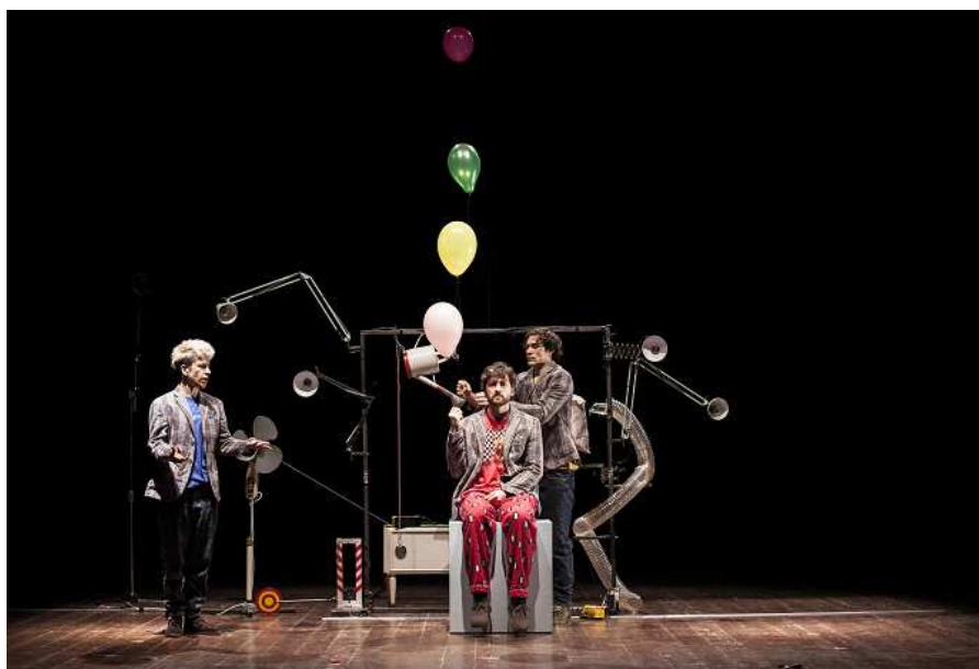
Fa la cosa Faticosa